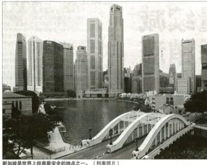
新加坡是世界上经商最安全的地方之一。(档案照片)

信用评级及结构科法斯集团(IHS GlobalVantage)新加坡地区评级重新升回最安全级别A1，这是新加坡企业在全球信用评级体系中的最高评级。这一评级反映了新加坡在地区安全评级中的领先地位，新加坡在地区安全评级中被评为最安全的地方之一。这一评级反映了新加坡在地区安全评级中的领先地位，新加坡在地区安全评级中被评为最安全的地方之一。